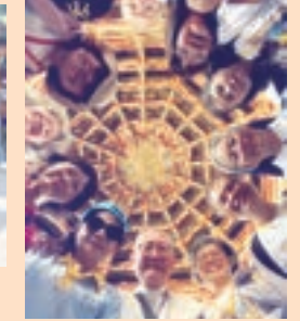
▲ 鹿港龍山寺的一個特殊景觀