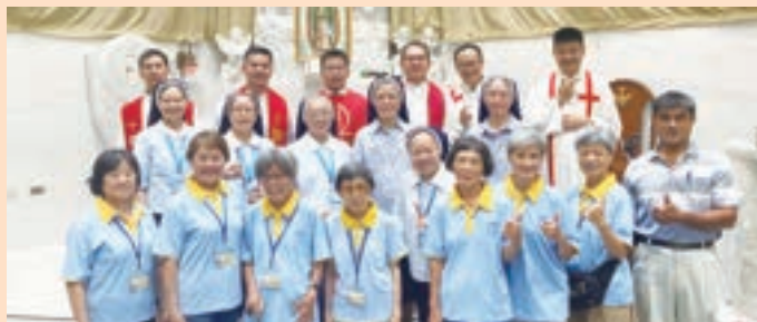
▲ 嘉義分會 (左 1-4) / 台中支會 (右 1-4) 與神父修女