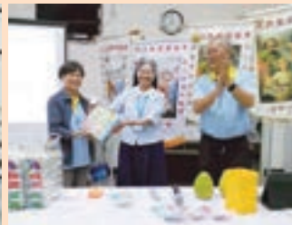
▲ 聖家修會黃總會長 (中) 致贈得獎會員禮品 (左)