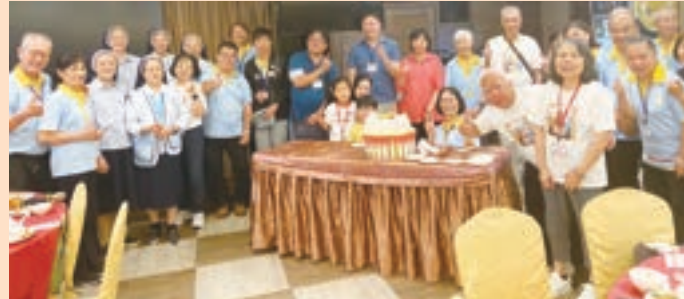
▲ 別開生面的慶生會