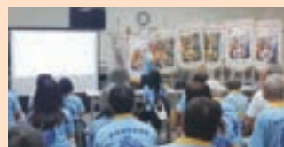
▲ 聖家善會會員專注聆聽總會長的工作展望報告