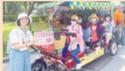
▲ 聖家善會租賃四輪電動車暢遊鹿港老街風景