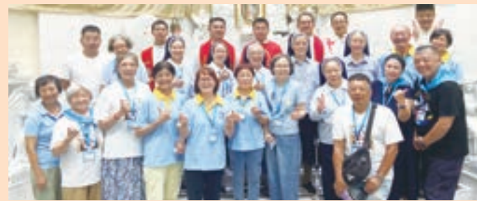
▲ 台北分會與神父修女