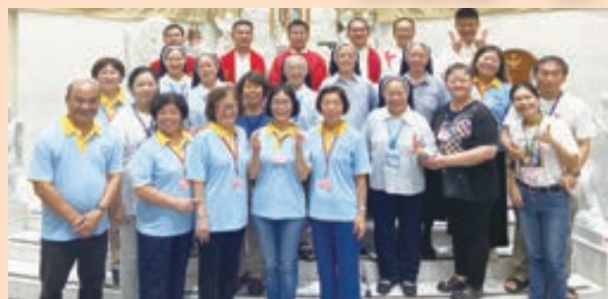
▲ 台南分會與神父修女