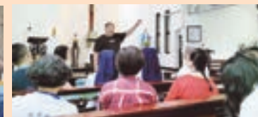
▲ 鹿港和平之后堂牧委會會長為善會簡報該堂歷史