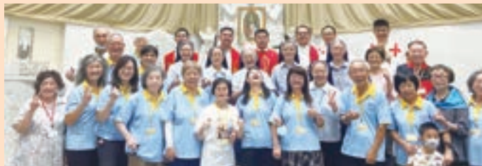
▲ 高雄分會與神父修女