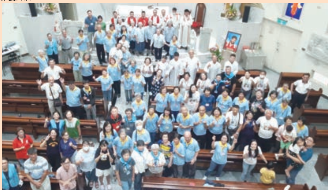
▲ 由教堂後二樓往下拍的大合照