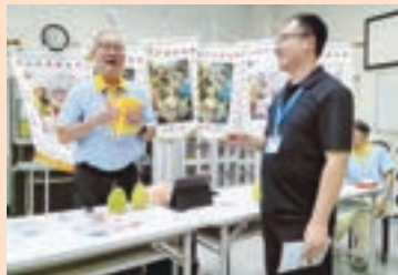
▲ 方總會長恭請神父摸出號碼球